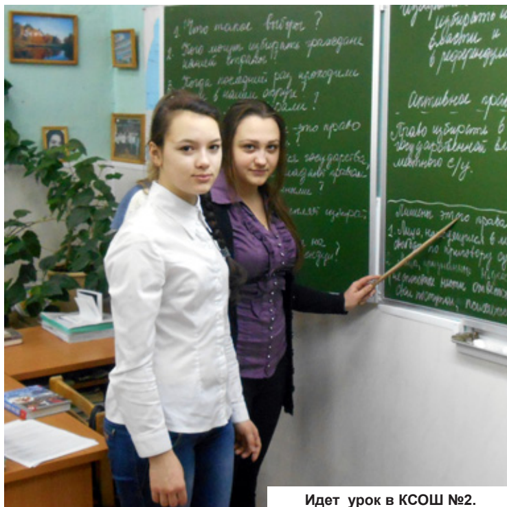
Идет урок в КСОШ №2.