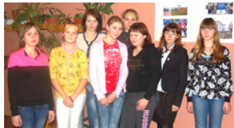
Члены студенческого совета.