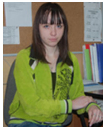
Лучший студент ЦБ-21.