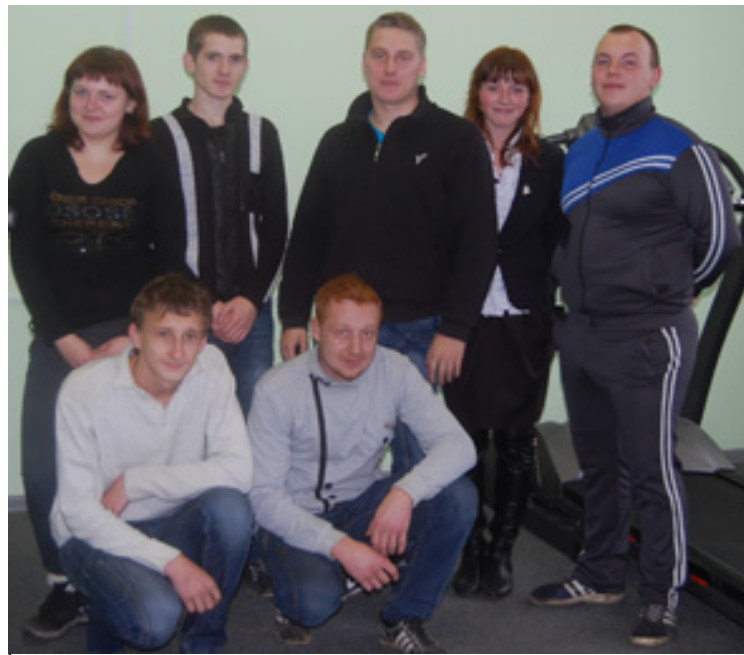
Самые активные спортсмены техникума.

Но самый большой наш проект – создание герба Кувшиновского техникума. Мы собираем средства своей сайт, и герб будет необходим. В общем, студенческий совет – это очень важная составляющая студенческой жизни. С его помощью ведется воспитательная работа, распределяются стипендии и премии... Студенческий совет – это коллектив неравнодушных, активных, жизнерадостных и немного «взбалмошных» ребят. Настоящих студентов!