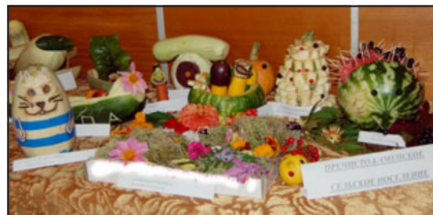
Сказочные гости из Пречисто-Каменки.