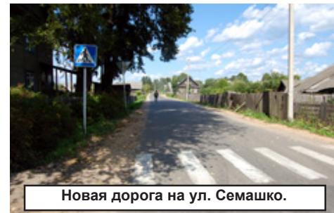
Новая дорога на ул. Семашко.

тябрьской, капитально отремонтированный за счёт бюджета города Кувшиново.