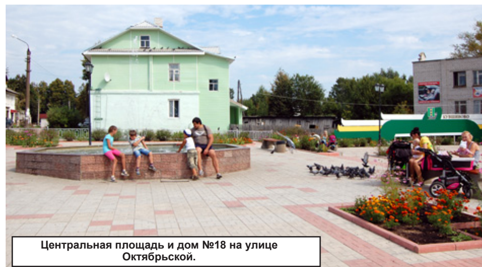
Центральная площадь и дом №18 на улице Октябрьской.

- по программе капитального ремонта многоквартирных домов (МКД) в соответствии с 185-ФЗ отремонтировано 20 МКД. Результат, правда, оказался спорным. Хочется по сравнению в жилищной сфере в сравнении жилой дом № 18 на ул. Ок-