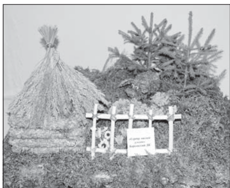
“Сердцу милый уголок” сделан руками работников Борковского СДК.