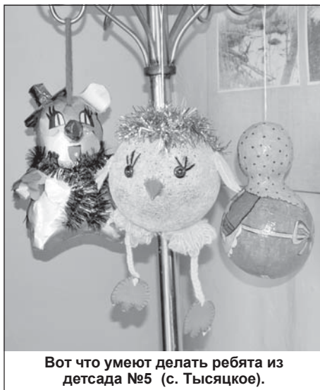
Вот что умеют делать ребята из детского сада №5 (с. Тысяцкое).