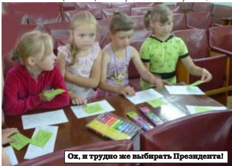
Ох, и трудно же выбрать Президента!