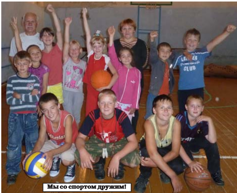
Мы со спортом дружим!