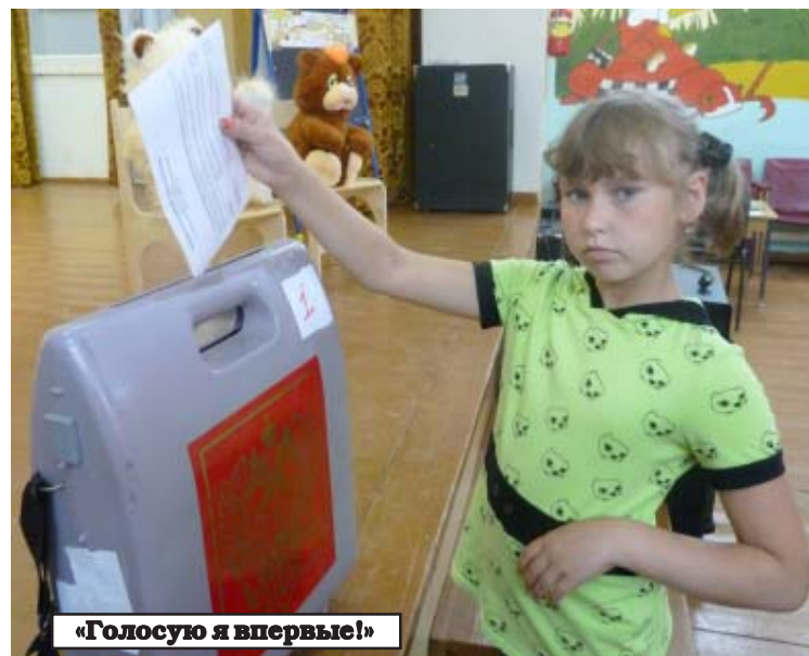
«Голосую я впервые!»