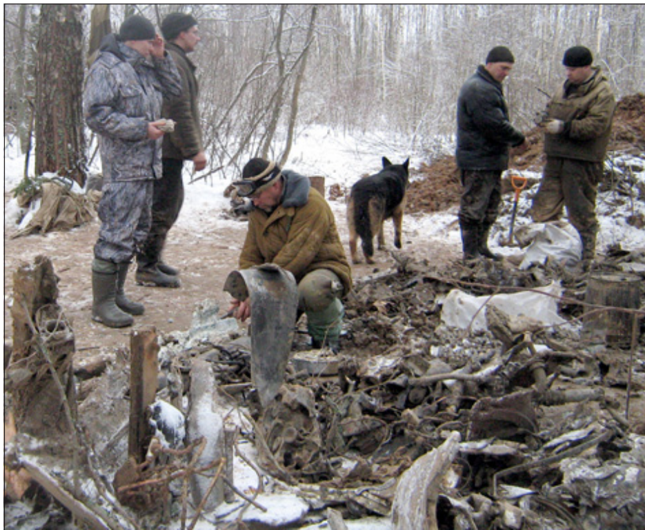
На месте поисковых работ.