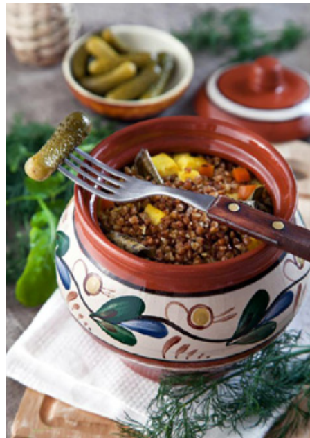
Страницу подготовила А. ЧИСТЯКОВА.

Сушеные белые грибы - 50 г - промыть, сложить в кастрюлю, залить 3 стаканами холодной воды, оставить в воде на 1-1.5 часа. Репчатый лук - 2 шт. и грибы мелко нарезать и поджарить на сковородке с 2-3 ст. л. масла. Поджаренный лук и грибы смешать с кашей.