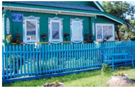
Вот такая красота на ул. Садовой.