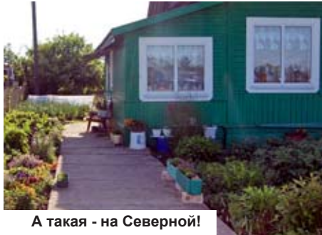
А такая - на Северной!