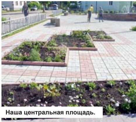
Наша центральная площадь.