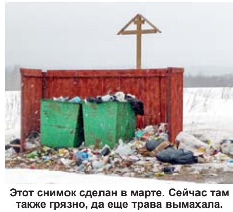
Этот снимок сделан в марте. Сейчас там также грязно, да еще трава вымахала.