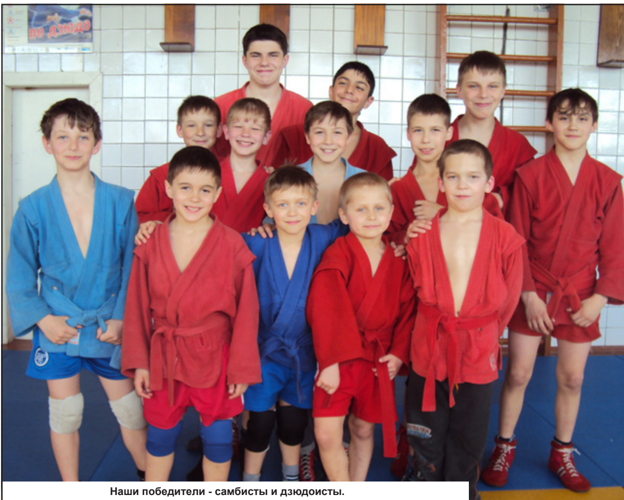
Наши победители - самбисты и дзюдоисты.

Младшей группе, в которой соревновались футболисты 2000 года рождения и младше, не удалось войти в тройку сильнейших, они заняли четвертое место.