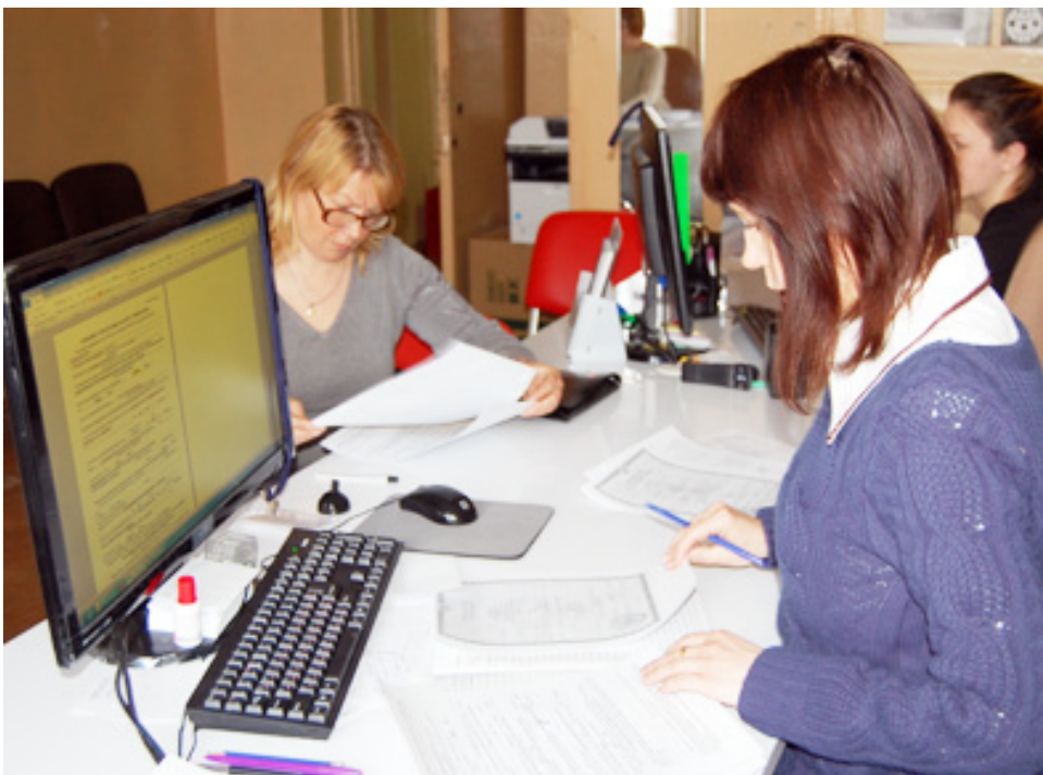
На консультации у специалиста МФЦ

– Весь перечень наших услуг прописан на официальном сайте и в соглашениях с межведомственными структурами. По всем направлениям работы, указанным на нашем официальном сайте, можно обращаться к нам в филиал. Естественно, не все из перечисленных функций востребованы гражданами на нашей территории. Четко налажена работа с налоговой службой. Единственное, что изменилось, с этого года мы не принимаем деклараций, что также прописано в соглашениях на высшем уровне. Все остальные государственные услуги предоставляются в полном объеме. Чаще всего обращаются за получением ИНН. Полным ходом идет работа по линии миграционной службы: снятие с регистрационного учета и постановка на него, выдача паспортов гражданина РФ. Отмечу, что пока мы не меняем загранпаспорта, это еще в перспективе. Совместно с пенсионным фондом занимаемся оформлением документов на получение материнского капитала, СНИЛС, справок о размере пенсии, переводе пенсии с расчетного счета на кредитную карточку. Эти направления деятельности среди нашего населения востребованы. По линии социальной защиты проводим регистрацию многодетных семей, назначение ежеме-