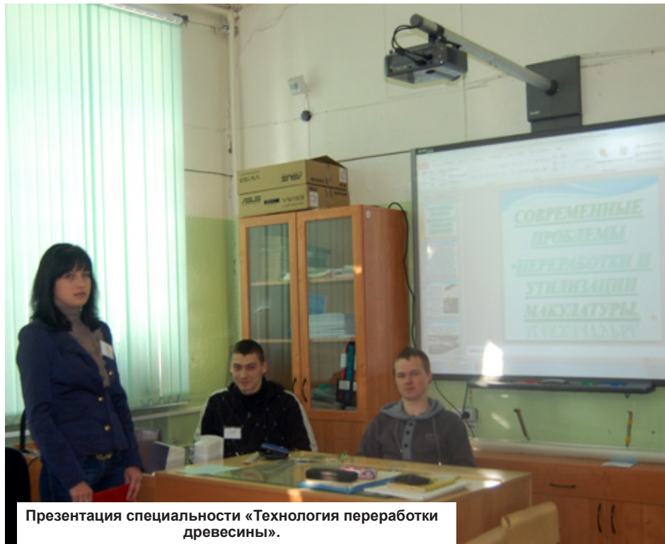
Презентация специальности «Технология переработки древесины».