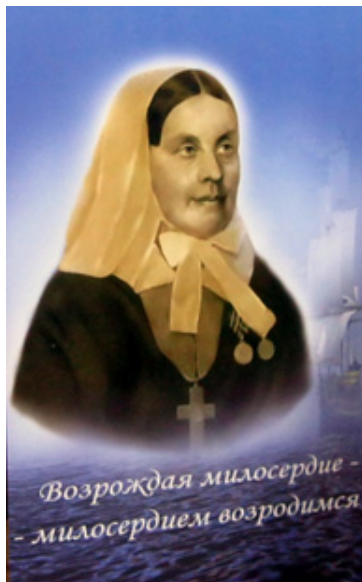
Возрождая милосердие – милосердием возродимся

На торжественный прием были также приглашены потомки дворянского рода Бакуни-