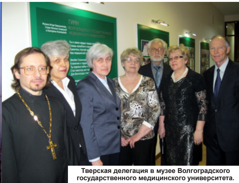
Тверская делегация в музее Волгоградского государственного медицинского университета.