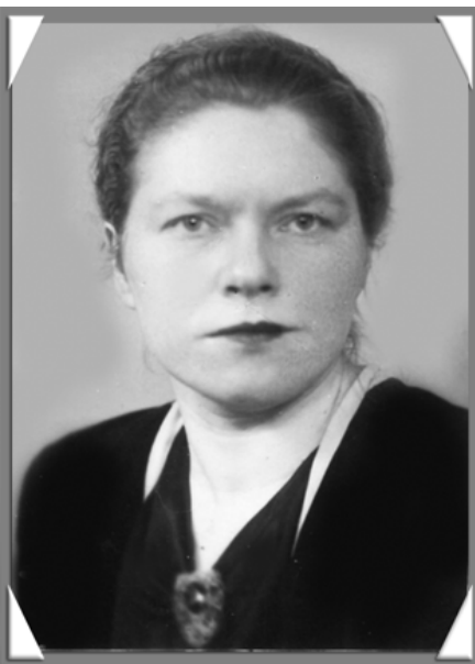
«За взятие Берлина» и «За взятие Варшавы».