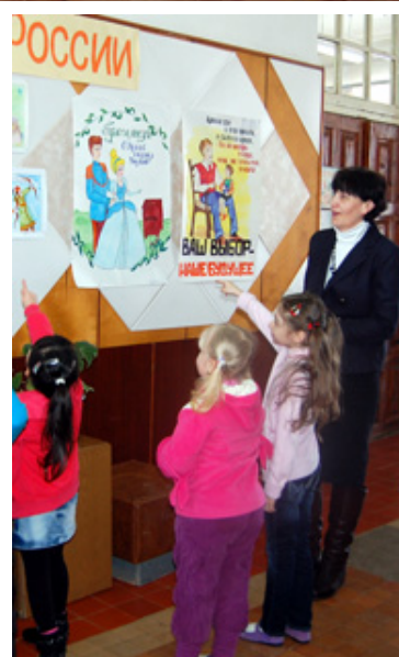
шие работы будут отправлены на областной конкурс.

В рамках информационной работы с молодежью также на базе РЦДТ прошла выставка рисунков и поделок на тему «Наш выбор - будущее России». Луч-